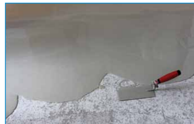
A munka megkezdésétől a felület kiegyenlítésének befejezéséig az anyagot folyamatosan keverjük be és hordjuk fel.