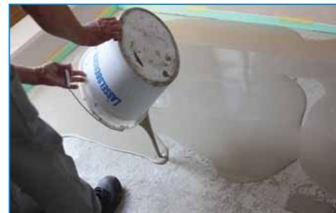
Határidős munkákhoz használjunk gyorskötésű anyagokat!

Szerszámok: rozsdamentes acél simító, tuskéhenger, kőműveskanál