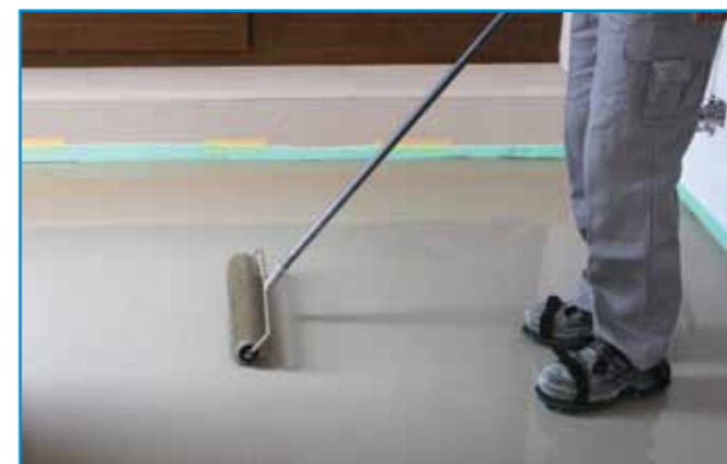
A gyorskötésű anyagoknál is fontos az önterülő aljzatkiegyenlítő kilevegőztetése.